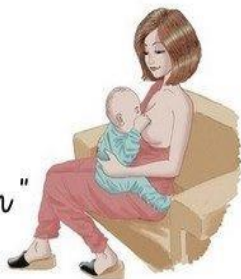
La position "à califourchon"