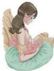
La position ballon de rugby