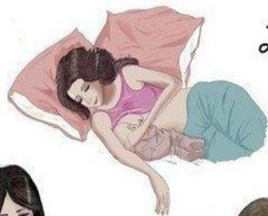
La position couchée