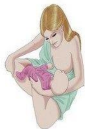
La position "madone" assise