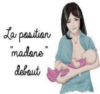
La position "madone" debout